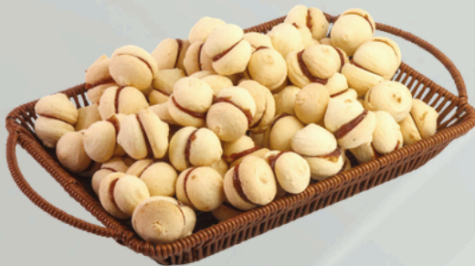
Beijinho de Freira 2Kg Cód.: 9146