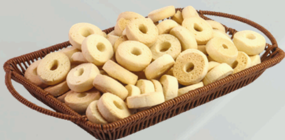
Sequihho Leite Cond. 2Kg Cód.: 500756