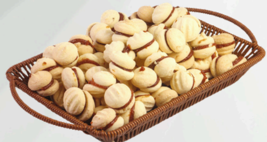
Casadinho 2Kg Cód.: 9147