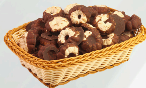
Ouro Branco 2Kg Cód.: 71473