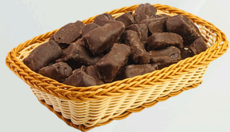
Bananinha 2Kg Cód.: 24260