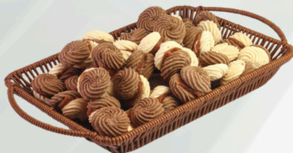
Choconata 2Kg Cód.: 76333