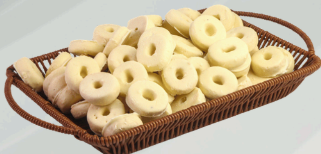
Branca De Neve 2Kg Cód.: 75850