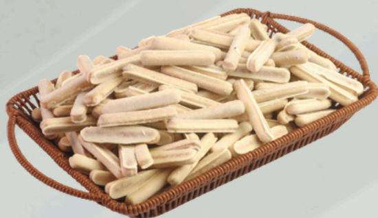
Palito Chocolate Branco 2Kg Cód.: 75848