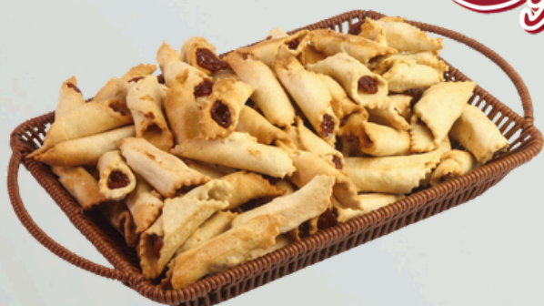
Beliscão 2Kg Cód.: 9149