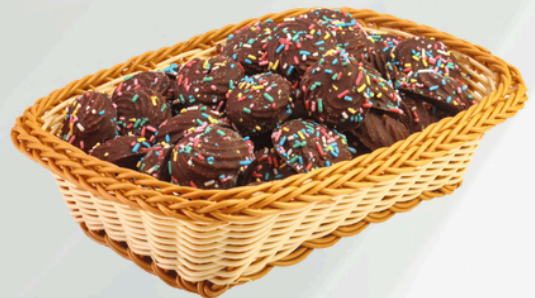
Chocofesta 2Kg Cód.: 72567