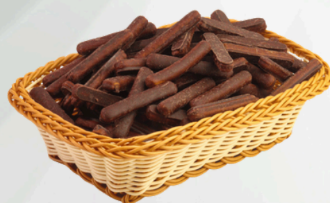
Palito Chocolate 2Kg Cód.: 9152