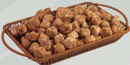
Cav. Banana Com Canela 2Kg Cód.: 25471