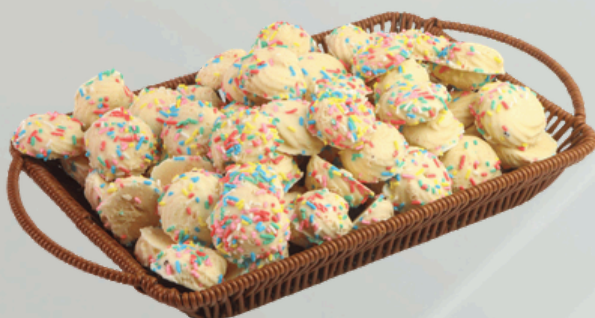
Chocofesta Branca 2Kg Cód.: 22714