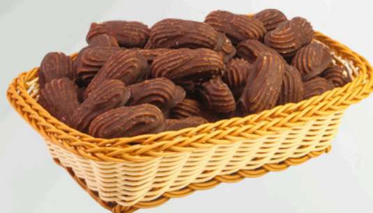
Prestígio 2K Cód.: 9218