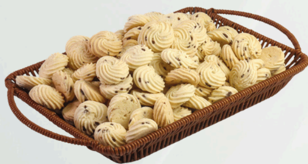
Rosca De Coco 2Kg Cód.: 9153