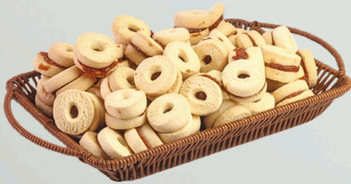
Bambole 2Kg Cód.: 9145