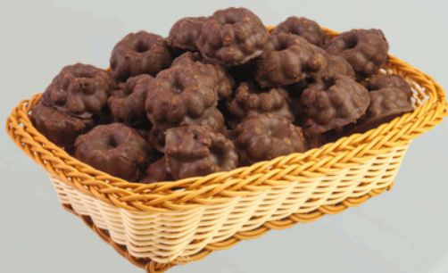
Ouro Preto 2Kg Cód.: 9151