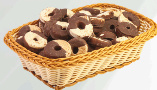
Juju 2Kg Cód.: 71472