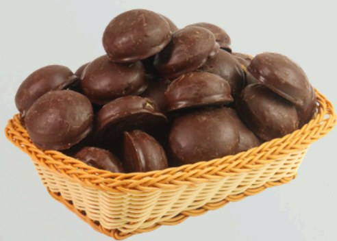
Pão De Mel 2Kg Cód.: 76332