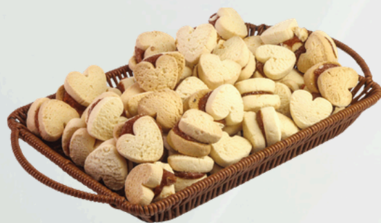
Coração Leite Ninho 2Kg Cód.: 500757