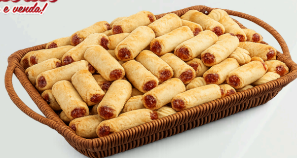
Cubinho 2Kg Cód.: 76334