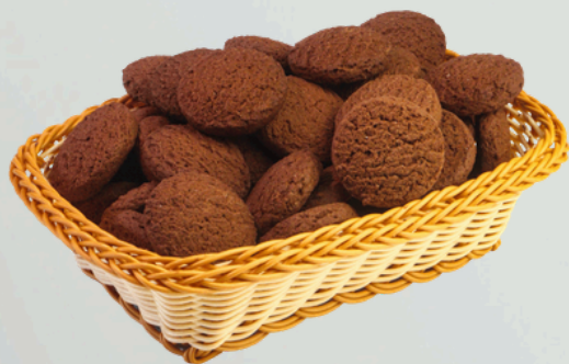
Cookies Chocolate 2Kg Cód.: 23905