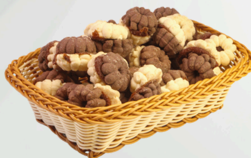
Uga Uga Chocolate 2Kg Cód.: 9157