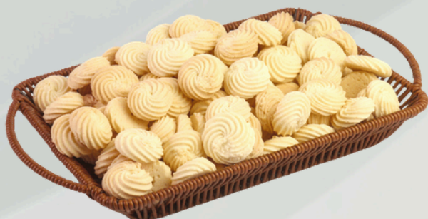
Rosca De Nata 2Kg Cód.: 9154